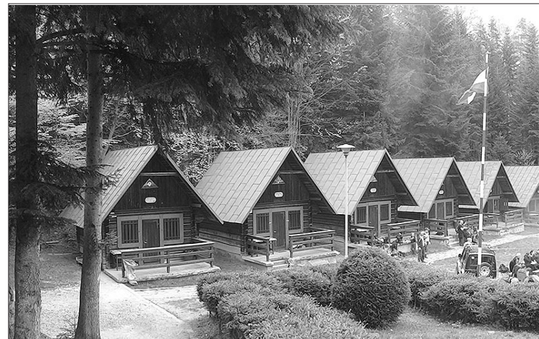
Współczesny wygląd ośrodka