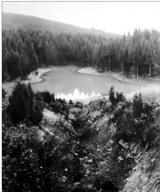
Jeziorko Żabie Oczko

Funkcjonował przeważnie w okresie letnim. Zjeżdżały się tutaj uczennice Liceów Pedagogicznych z Limanowej, Starego i Nowego Sącza, Tarnowa, Żywca, Krzeszowic i realizowały praktyczną część programu wychowania fizycznego. Oprócz tego odbywały się tutaj kursokonferencje nauczycieli i działaczy sportowych, zaś w okresie zimowym organizowane były zimowiska dla szczerpów harcerskich.