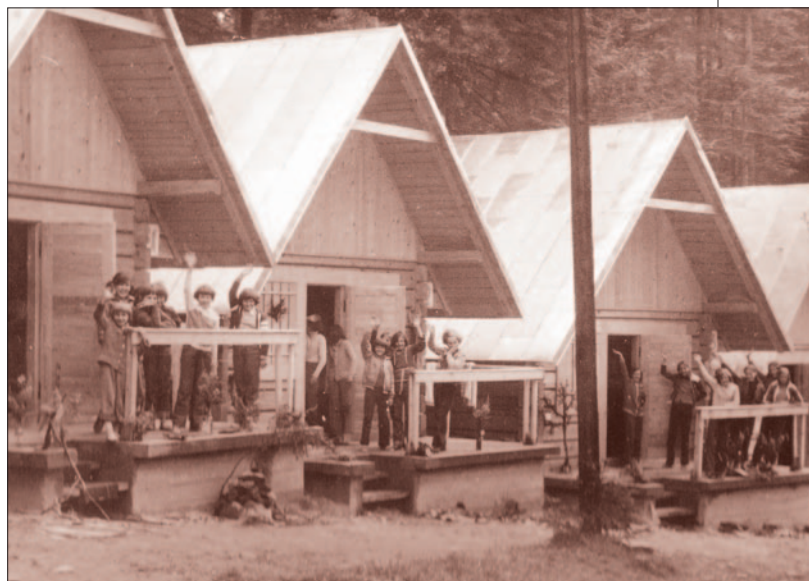
4.07.1979 r. – uroczyste otwarcie nowych chat

Do okien ściany wykonywane były z poziomo ułożonych belek. Następnie na pionowych słupach spoczywał dach. Zamiast okien między słupami znajdowała się wolna przestrzeń zamykana roletami na noc. Wszystkie dachy pokryte były czarną papą.