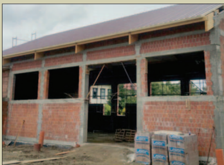
Inwestycje kubaturowe idą pełną parą STR. 7