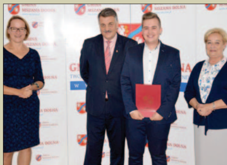
Wójt nagrodził młodych sportowców i artystę STR. 6