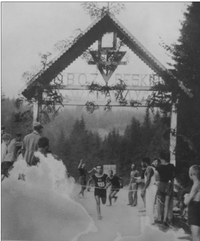
Brama wejściowa do ośrodka

Według opinii licznych cudzoziemców i rzeczoznawców obozownictwa za granicą – obóz polskiej YMCA należał do najpiękniej położonych, najlepiej wyekwipowanych i najracjonalniej prowadzonych obozów dla chłopców nie tylko w Polsce, lecz i w całej Europie.