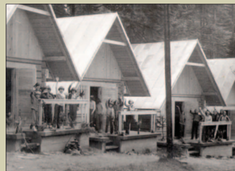
95 lat Bazy Szkoleniowo-Wypoczynkowej Lubogoszcz STR. 27