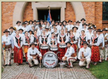
Jubileusz 110-lecia Orkiestry Echo Gór z Kasinki Matej STR. 4