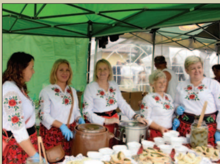
Beskidzkie rytmy i smaki STR. 20