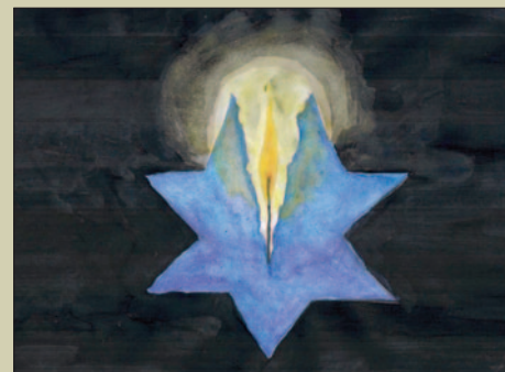
80. rocznica Zagłady Żydów w Mszanie Dolnej STR. 32