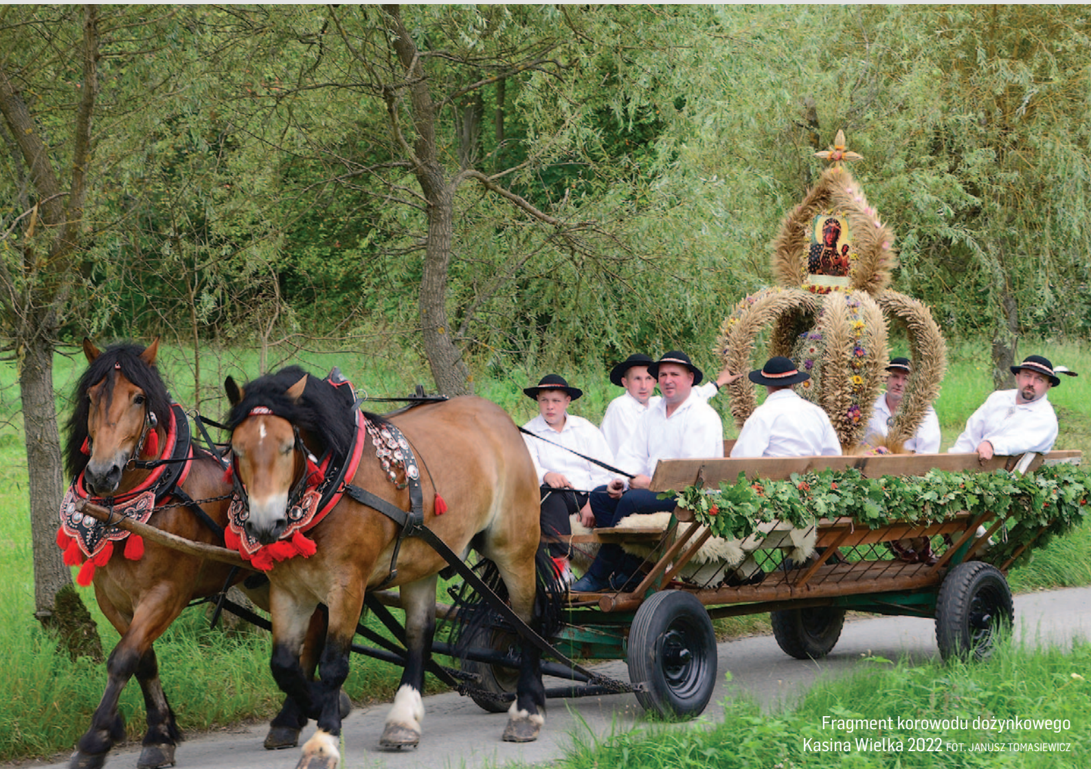
Fragment korowodu dożynkowego Kasina Wielka 2022