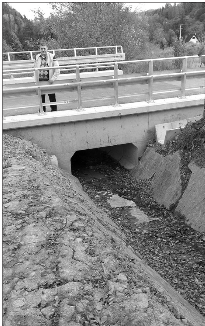
Wyremontowana droga Raba Niżna- Gęsia Szyja – Glisne