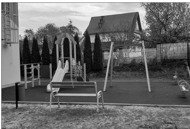
Plac zabaw przy szkole nr 2 w Mszanie Górnej