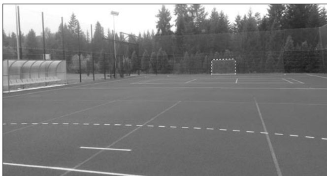
Boisko sportowe przy szkole nr 2 w Kasinie Wielkiej

Końcówka roku 2019 jest dla inwestycji kubaturowych etapem zamykania rozpoczętych prac budowlanych czy też remontowych. I tak na finiszu są prace rozpoczęte w sierpniu 2017 r. związane z budową sali gimnastycznej w Mszanie Górnej. Wykonano już wszystkie prace wykonaniowe zarówno wewnątrz jak i na zewnątrz budynku tj. nowe ogrodzenie, poszerzono bramę wjazdową, wykonano