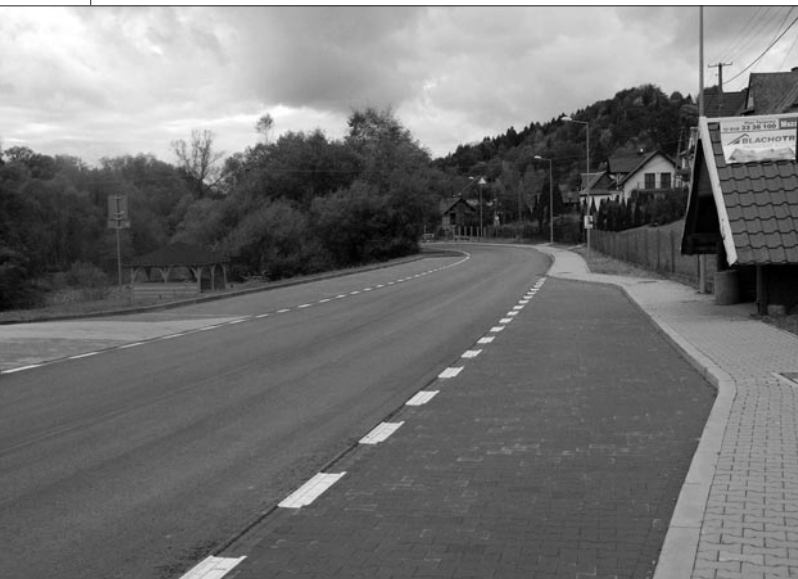
Droga powiatowa w Łostówce

nową nawierzchnię pod placem zabaw. Aktualnie oczekujemy na pozwolenie na użytkowanie obiektu i będzie można przekazać salę społeczności szkolnej.