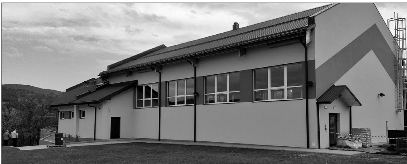
Sala gimnastyczna przy szkole nr 2 w Mszanie Górnej