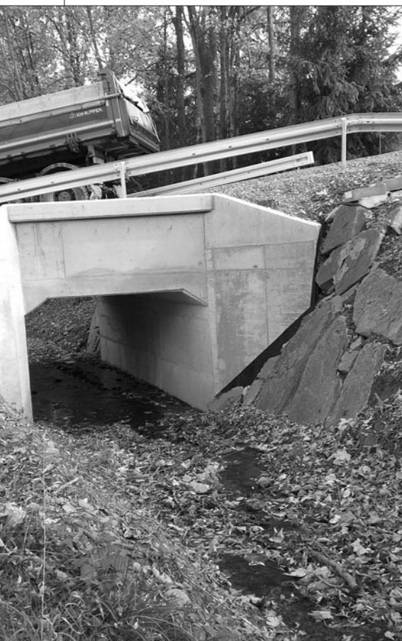
Przepust w drodze do os. Gacki w Olszówce

Przeglądu inwestycji dokonali Pracownicy Referatu Inwestycji i Zamówień Publicznych Urzędu Gminy w Mszanie Dolnej