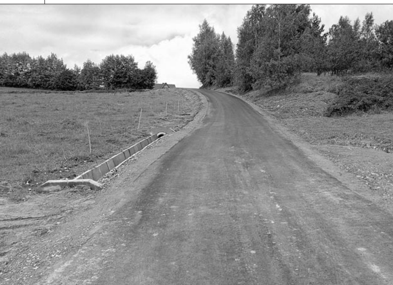
Droga do os. Górki w Lubomierzu

na. Z Funduszu Dróg Samorządowych przeznaczono na tę inwestycję kwotę 3 mln 562 tys. 662 zł. Powiat Limanowski zaangażował na ten cel środki własne w kwocie – 2 mln 749 tys. 969 zł., natomiast Gmina Mszana Dolna – przeznaczyła ze swego budżetu 928 tys. 311 zł. na modernizację drogi w Łostówce.