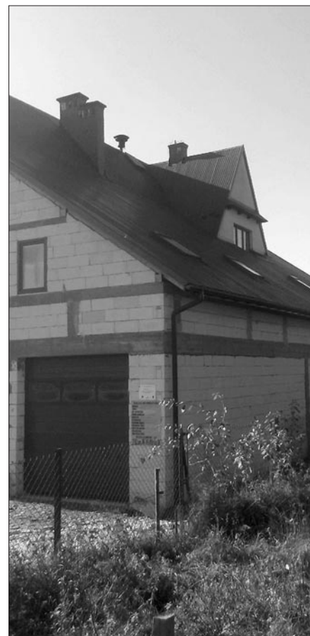
Dobudowana część remizy strażackiej w Łętowie