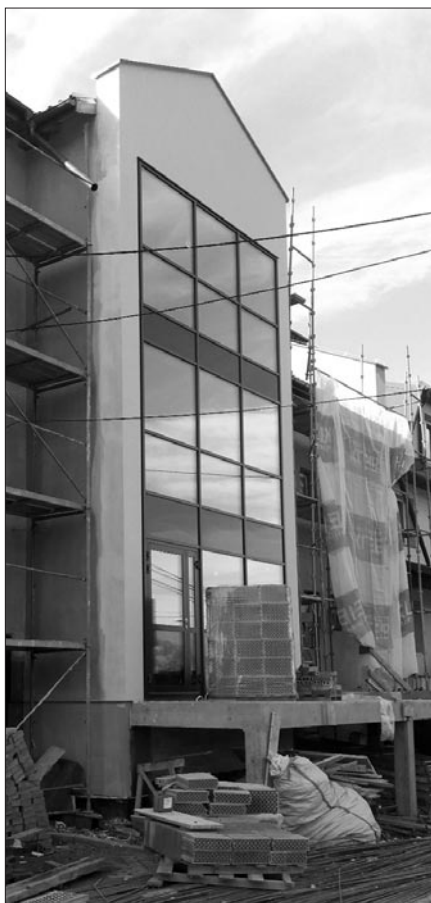
Elewacja ośrodka zdrowia w Mszanie Górnej